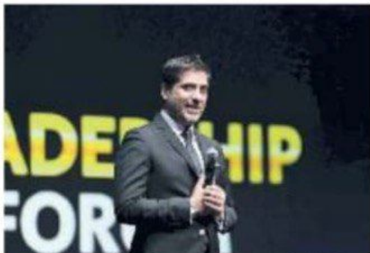
Due momenti della conferenza al teatro degli Arcimboldi di Milano

Il business event, intitolato non a caso "Turning point", ha rappresentato un'opportunità unica per lasciarsi ispirare dai più importanti pensatori sulla leadership e sul management in un periodo ricco di sfide e processi di cambiamento. Fra gli speaker internazionali